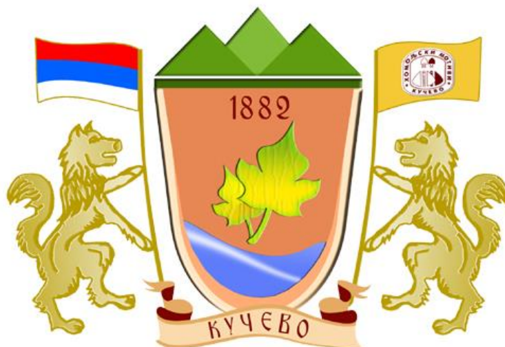
Слика 1 – Грб Општине Кучево

Општина обележава 8. јул као Дан општине Кучево . Рад органа Општине Кучево је јаван.